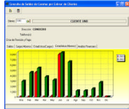
Analizar la información en línea SIF PRO es la opción

SIF PRO nace para Internet y se posiciona como una opción para nuestros clientes de mejor comunicación. Uno de los servicios que tiene SIF PRO, es el envío de estados de cuenta a petición del mismo cliente, sin que intervenga el usuario, solo el cliente y el hardware. Esto es servicio y mejor atención a nuestros clientes.