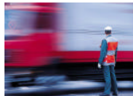
SIF PRO le proporciona la rapidez que Usted esperaba en un sistema

PIII-1.4ghz en adelante Windows 2000, 2003 server, Linux®, Novell®* 256MB de ram (512MB recomendado) 2GB en espacio libre de disco duro VGA 800x600 CD ROM Drive *APLICA LICENCIAMIENTO ESPECIAL DE BORLAND INTERBASE